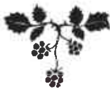
TABLE DES ILLUSTRATIONS