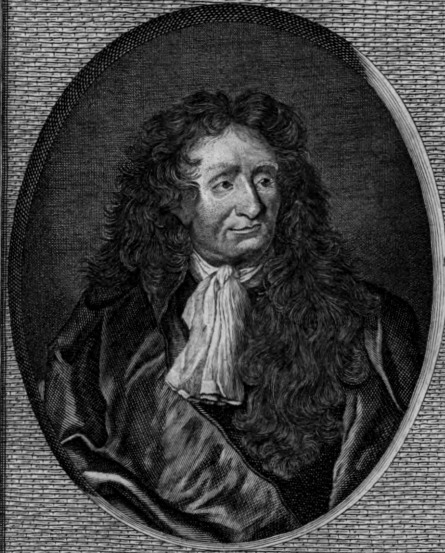
JEAN DE LA FONTAINE .