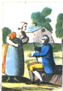
Le mal marié

Que le bon soit toujours camarade du beau Des de main je chercherai femme.