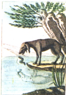
Le Chien qui lâche sa proie p r l'ombre.

On voit courir après l'ombre Tout de fois qu'on en voit pas, La plupart du temps p r le nombre.