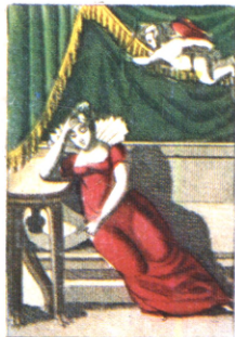
La Jeune Veuve.

La perle d'un Epoux ne va point sans soupçons: On fait beaucoup de bruit, et puis on se console.