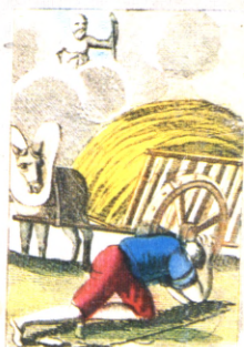
Le Chartier embourbé.

On voit courir après l'ombre Tout de fois qu'on en voit pas, La plupart du temps p r le nombre.