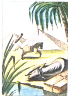
Le Cheval et l'Âne.

Encore demande il ce fait l'un l'autre secourir.